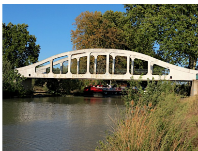
Le pont de Cers