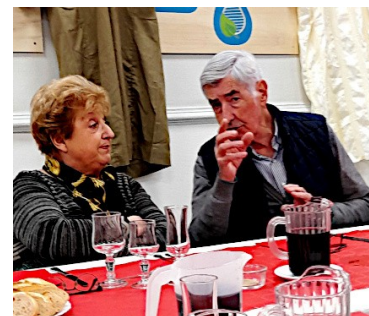
A table, discussions animées ....

Je terminerai ce bref compte-rendu, en ce début d'année, par mes vœux les plus vifs pour vous-mêmes et les vôtres. Malgré les difficultés qui s'accumulent, il faut garder espoir.