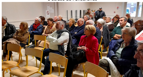
Un auditoire passionné

Au moment de nous séparer, en milieu d'après-midi, chacun était ravi de cette rencontre et nombreux étaient ceux qui souhaiteraient ramener d'autres anciens à participer aux activités de l'Association.