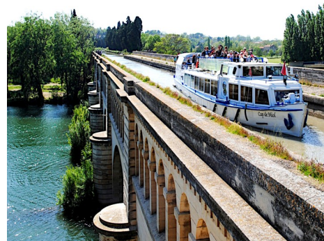
Le Pont-Canal de Béziers

Les applaudissements recueillis par notre conférencier sont largement mérités et nous accompagnent auprès d'un superbe buffet apéritif permettant de nombreux échanges et des retrouvailles animées.